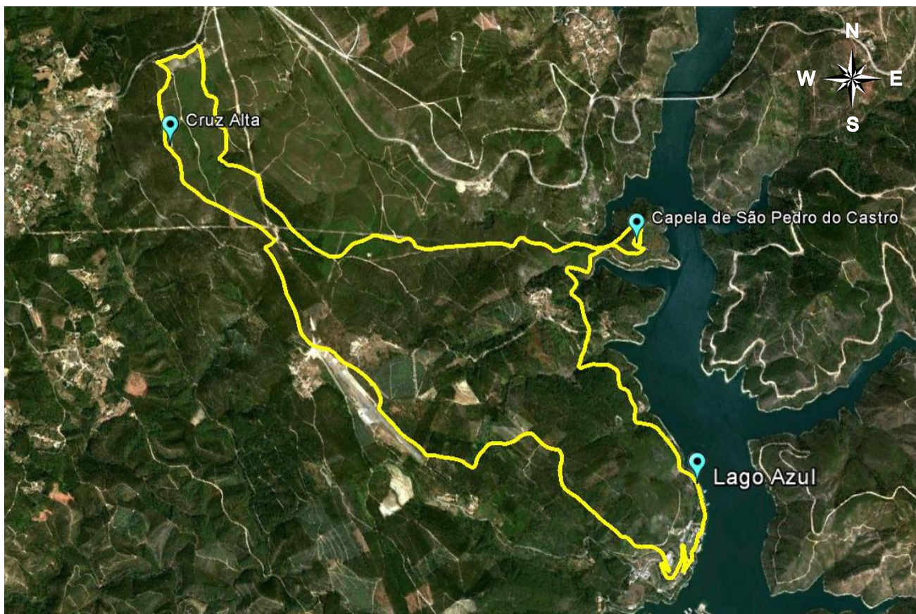
Percurso Pedestre – LAGO AZUL – PROJEÇÃO DO PERCURSO NO MAPA