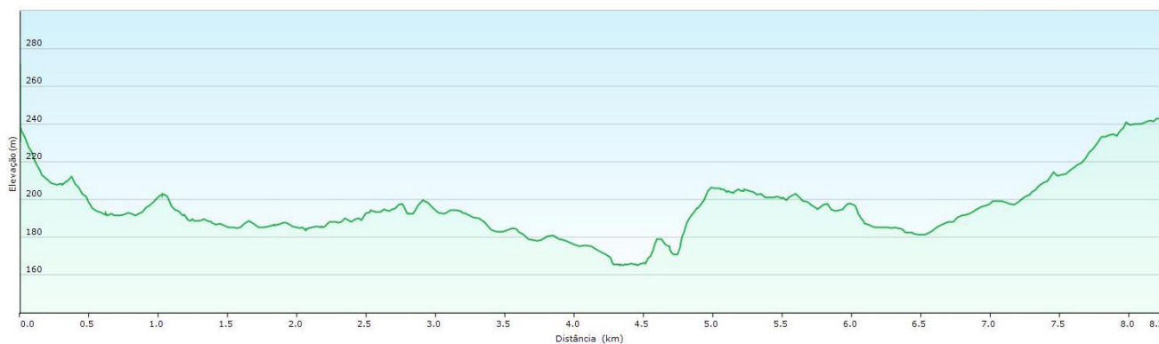
Percurso Pedestre – PIAS – PERFIL DE ELEVÇÃO